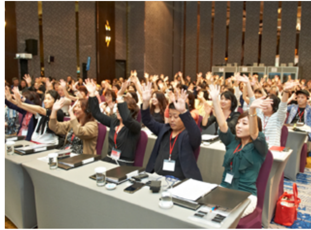
各國會員熱情地與大家歡呼互動

慕立達學院課程的目的，就是要幫助各國以培育更多核心領袖，並指導如何建立穩健紮實的組織與源源不絕的收入管道。慕立達秉持著幫助世人獲得人生最渴望的三件事：健康的身體、好看的外表以及財務自由，持續拓展市場與分享遠景。