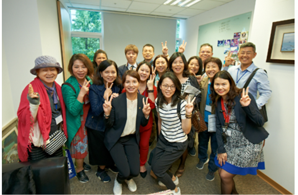
台灣分公司第一次開放參觀辦公室內部，每位領袖都非常興奮

時間來到了 5 月 24 日午後，也是慕立達學院的結業式。在結業典禮之前，Shon 也向大家宣布下一次慕立達學院，將於 10 月 8 日至 12 日於日本宮崎喜來登海洋度假