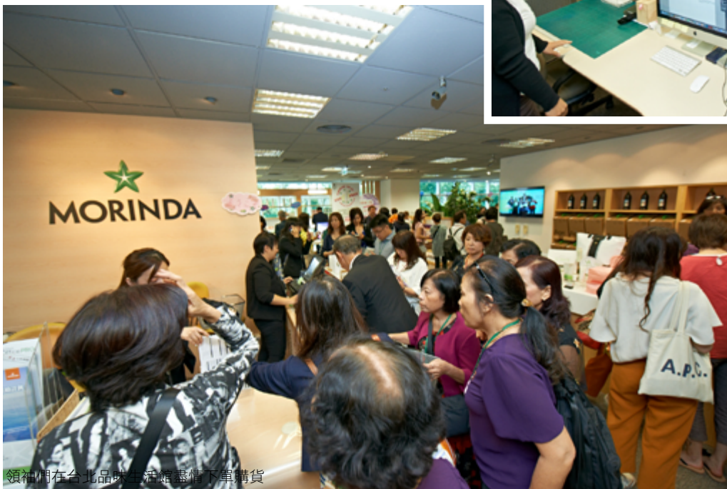
領袖們在台北品味生活館盡情下單購貨

備大溪地諾麗® 果汁及諾麗茶熱情迎接嘉賓，並致贈每位領袖一份參訪好禮；緊接著讓領袖們認識台灣分公司的歷史發展與周邊景點特色。