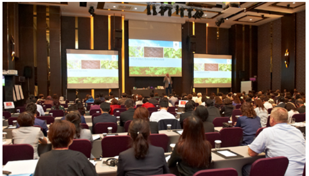
現場近 200 位領袖一同來台參與事業盛會

慕立達在 2018 年底，與新世紀飲品合併之後，更是一躍成為全球前 40 大健康飲品上市公司！每一個人都在尋找好的產品以及獲得更多收入的方法，選擇慕立達正是商機無限大的最佳時刻！