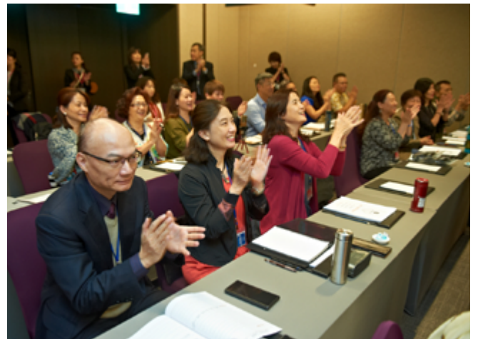
每日會議重點都會在國家會議中更詳細讓領袖們了解

立達獎金制度的魅力，以及建立收入與事業計劃的秘訣。豐富的課程內容與小組討論，讓與會的領袖們不僅單向地吸收知識，還能雙向交流所學及想法，讓學習的觀念更落實到實務操作。